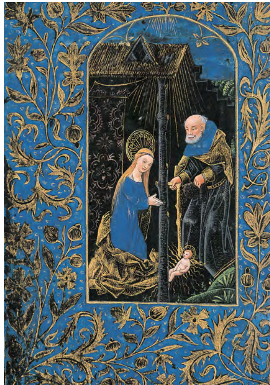
#146 Czarne Godzinki: Święta Rodzina