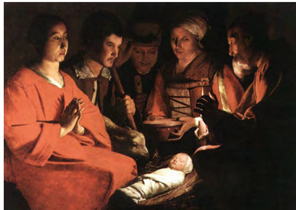
#142 Georges De La Tour, Pokłon Pasterzy (całość), ok. 1644